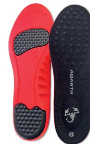
Tallas 36-39: Ref.ABAC002-36 Tallas 39-42: Ref.ABAC002-39 Tallas 42-45: Ref.ABAC002-42