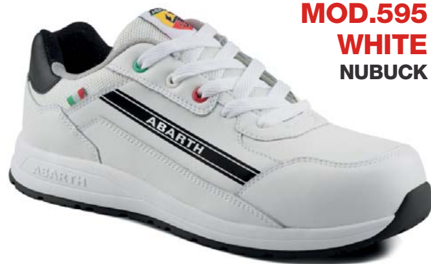
MOD.595 WHITE NUBUCK