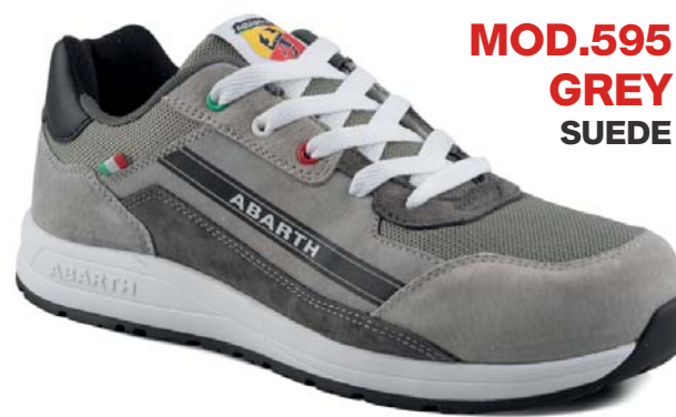
MOD.595 GREY SUEDE