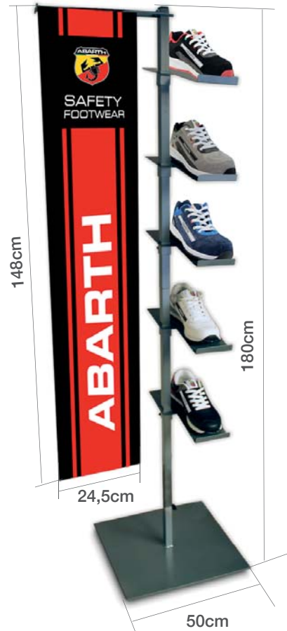
Bandera Abarth Abarth safety Flag