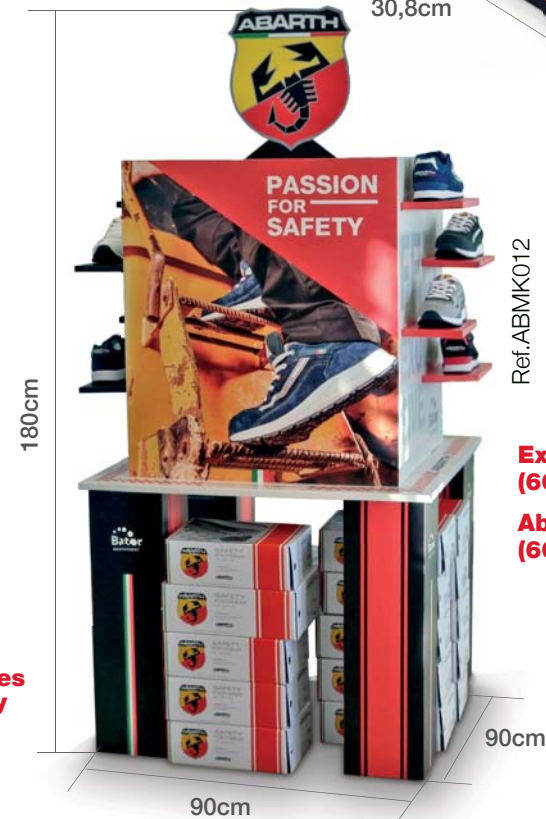
Expositor grande Abarth (60 zapatos)