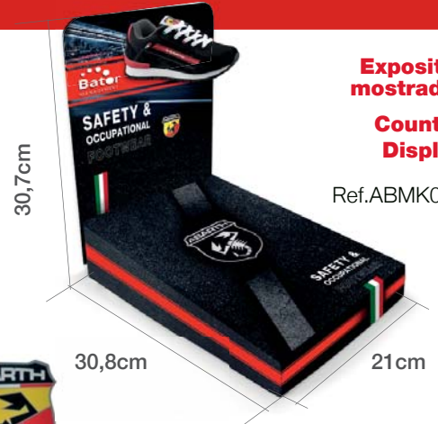
Expositor mostrador Counter Display