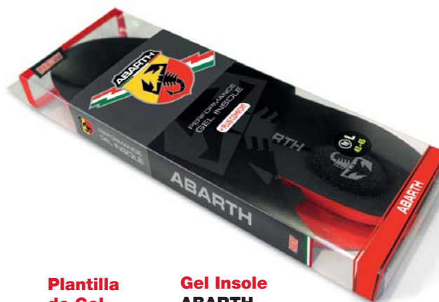
Plantilla de Gel ABARTH +PLUS CONFORT