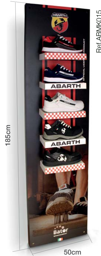
Expositor pared Abarth 5 posiciones Abarth shoes wall display 5 positions