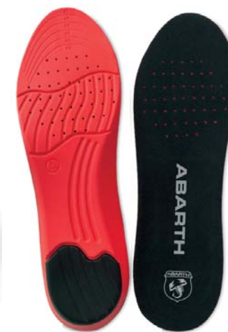
Tallas 36-41: Ref.ABAC001-36 Tallas 42-47: Ref.ABAC001-42