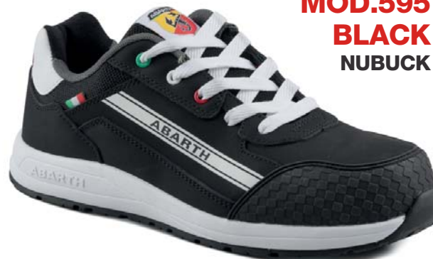
MOD.595 BLACK NUBUCK