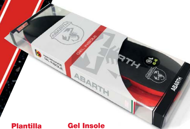
Plantilla de Gel ABARTH Performance