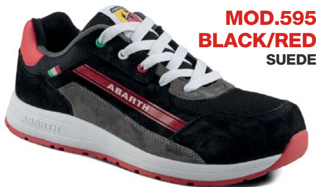
MOD.595 BLACK/RED SUEDE