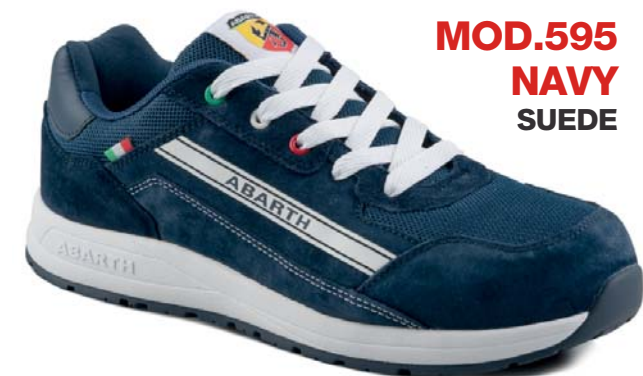
MOD.595 NAVY SUEDE